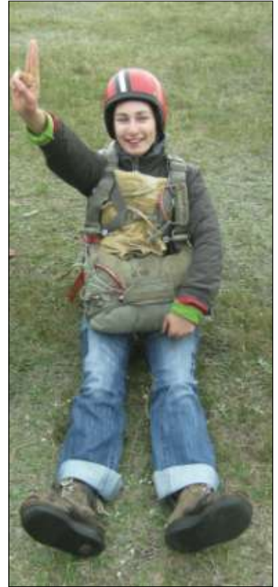
К учебе готова!